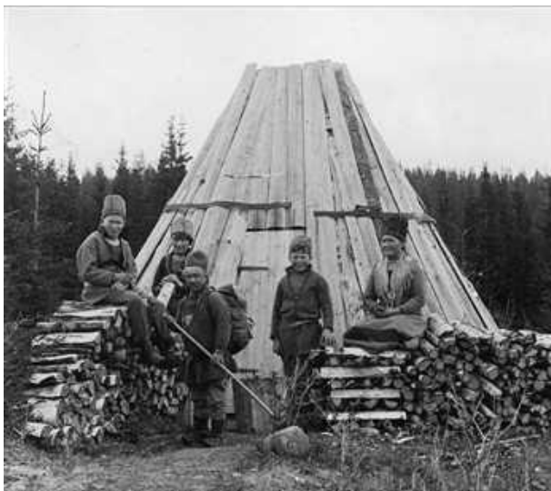
Kåtan i Stridsberg

En höst bestämde vi att jag skulle fara till Stridsberg och sätta upp en kåta där. Vi skulle bo där över vintern. Jag var där ett par dagar och hög och drog fram lämpligt virke.