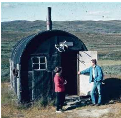
Baracken i Stekenjokk

Baracken är en kvarleva efter ett par sommars geologiska undersökningar på 1920-talet. ( Gruvan öppnades på 1970-talet ). Lappväsendet i Västerbottens län köpte de båda baracker som fanns i området och upplät dem som "renvaktarstugor". En barack i Stekenjokk och en som flyttades till Tjokkola.