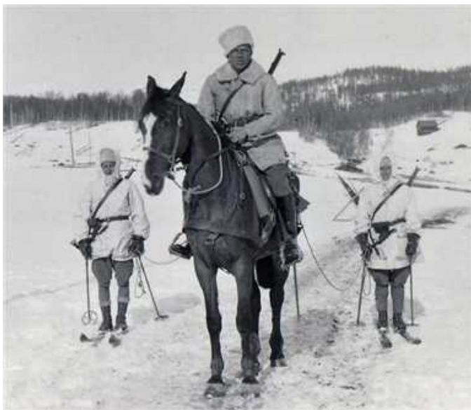
Kjell till häst KA4

Vår kavalleribataljon blev med åren ett av Sveriges mest beresta förband. Förbandet verkade i sex provinser. Man hade tanken om att rörliga ryttarförband skulle lära känna stora delar av landet så att små grupper, i kritiskt läge, kunde placeras ut i spanings-syfte. Man skulle kunna verka i all den terräng landet kunde erbjuda. Det blev ofta mycket jobbigt då man måste inrätta sig i ständigt nya trakter. Jag klagade inte för jag tyckte det var roligt med omväxling.