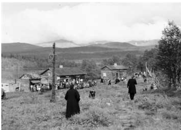
Fatmomakke ca 1954

Under vår vandring mot Fatmomakke mötte vi många människor som var på väg dit. En del var gamla bekanta men det fanns även många vi inte kände igen. Ju närmre kyrkplatsen vi kom desto fler människor syntes.